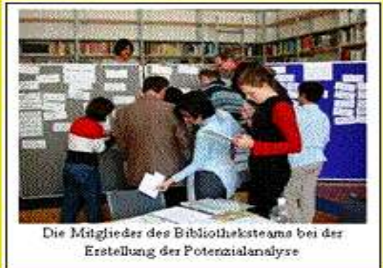
Die Mitglieder des Bibliotheksteams bei der Erstellung der Potenzialanalyse

Unsere Zielgruppen sind die Schulgemeinschaft, die Eltern und ehemaligen Lehrpersonen und Schüler/innen.