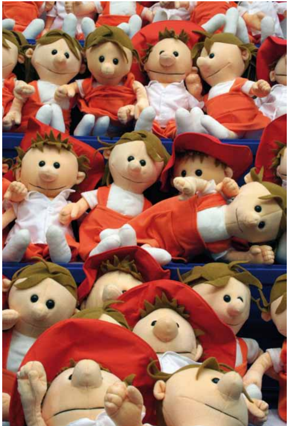
Greta und Anton sind immer mit dabei: Die 40 Zentimeter großen Figuren aus dem Bilderbuch »Anton und die Mädchen« von Ole Könnecke wurden speziell für das Projekt angefertigt.

Die quantitative Erhebung unter den Erzieherinnen ergab (n=16), dass die Mehrzahl die Bücherhalle monatlich bis alle paar Monate besucht. Die Koopera-