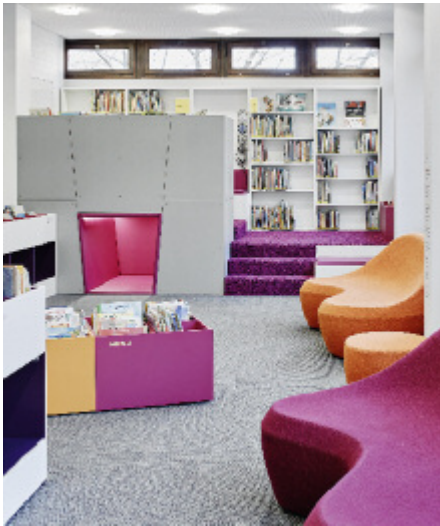
▲ Das fröhliche Farbkonzept in Lila, Magenta und Orange schafft eine angenehme Atmosphäre im Kinderbereich. Das Podest mit Liegekoje bietet einen Rückzugsraum für den ungestörten Mediengenuss.