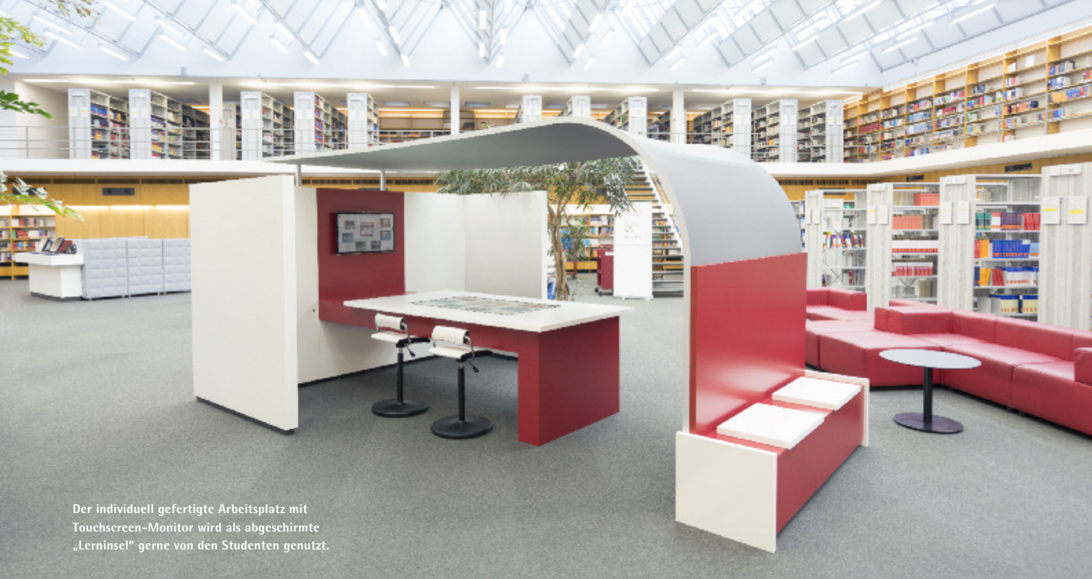
Der individuell gefertigte Arbeitsplatz mit Touchscreen-Monitor wird als abgeschirmte „Lerninsel“ gerne von den Studenten genutzt.