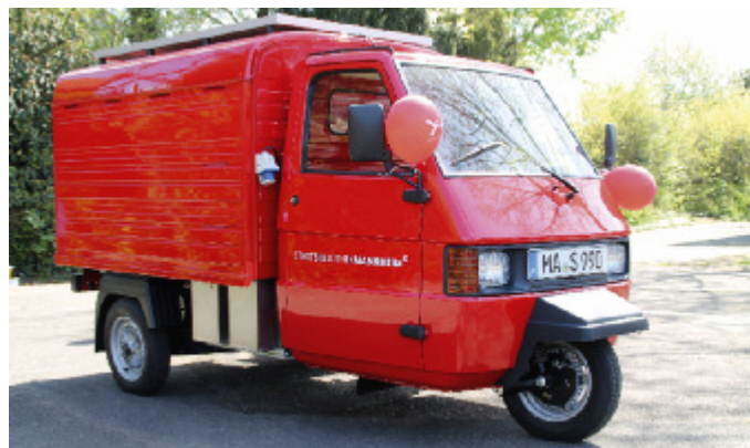
Bibliothek ist da, wo der Kunde ist: Das brandneue mobile Mannheimer „Bibliothekslabor“ vermittelt spielerisch den Umgang mit neuen Medien.

Das neue mobile Bibliothekslabor ist ein dreirädriger, leuchtend roter Kastenwagen der Firma Piaggio („Ape“), welcher speziell für diesen Zweck modular umgebaut und mit Elektroantrieb umgerüstet wurde. Die damit geplanten Aktionen werden vom Team Bibliothekspädagogik und Medienpädagogen vorbereitet und durchgeführt.