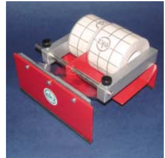
Artikel-Nr. / N° / No. 803308.4