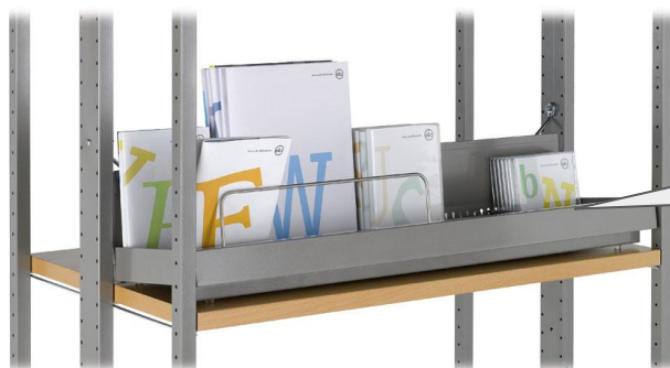
Medienaufsatz für Regalfachboden ekz-Nr. A8039849

Sie wollen auch eine Saatgutbibliothek in Ihrer Bibliothek aufbauen? Dann zeigen wir Ihnen hier welche ekz-Produkte Sie für die Präsentation der Samentütchen nutzen können.