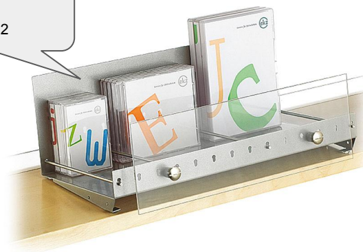
Fachbodenaufsatz für Mischmedien ekz-Nr. A8039702