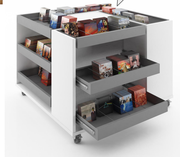
Präsentationspodest AV ekz-Nr. A9231363