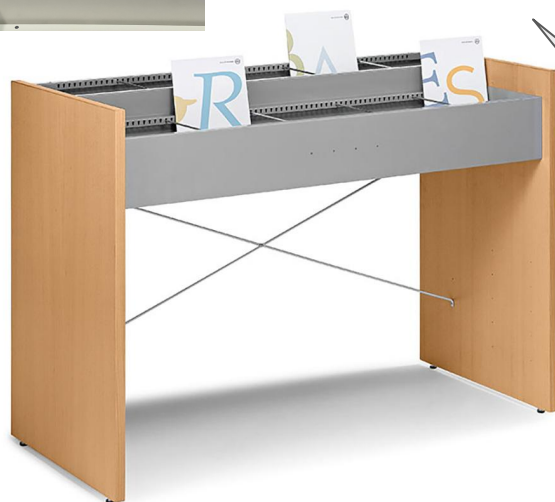
Medientröge , im Regal fest verbaut, herausziehbar, oder die freistehende Variante N2, N3 und H5.