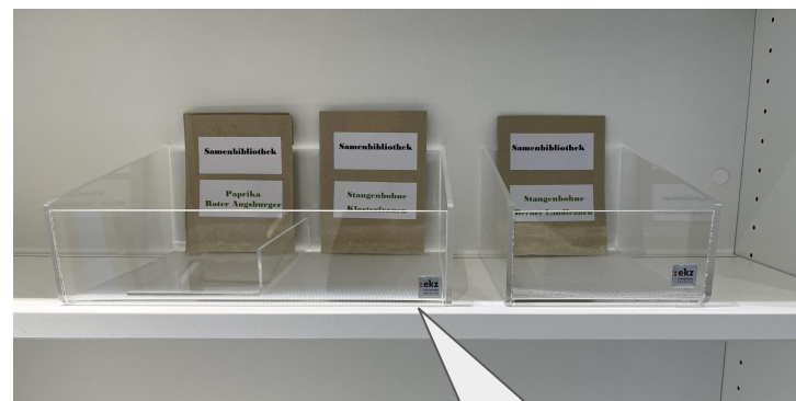
Stöberboxen S - ekz-Nr. A8010804 M - ekz-Nr. A8010815 L - ekz-Nr. A8010826 Bei der Größe M und L empfehlen wir zusätzlich den Unterteiler ekz-Nr. A8010837