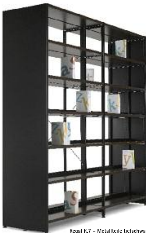
Regal R.7 – Metallteile tiefschwarz ähnlich RAL 9005, Holzteile Kunststoffdekor Ahorn Aftereight