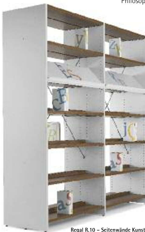
Regal R.10 – Seitenwände Kunststoffdekor Playground Pistazie, Fachböden Kunststoffdekor Nussbaum Aragon